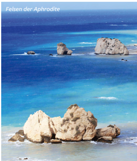
Felsen der Aphrodite

Die venezianische Stadtmauer von Famagusta umschließt eine orientalisch anmutende Altstadt mit schmalen Gassen und gotischen Kirchenruinen. In Salamis beeindruckt uns die Ausgrabung mit den ehemaligen Thermen und dem Theater. Außerdem sehen wir Zeustempel, Gymnasium mit Palästra, Stadion, die Basiliken mit ihren Mosaiken und die Königsgräber. Wir besuchen das St. Barnabas-Kloster, für die orthodoxen Christen auf Zypern ein Ort von höchster Bedeutung.