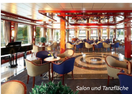
Salon und Tanzfläche