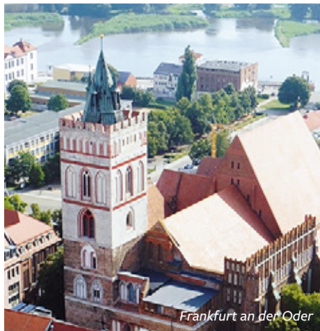
Frankfurt an der Oder

Dann windet sich die Oder durch ein breites Tal und wir erreichen Ścinawa. Von hier aus kann ein Ausflug nach Legnica, ehemals Liegnitz, mit seinem stattlichen Piastenschloss unternommen werden. Die Nacht verbringen wir in Malczyce.