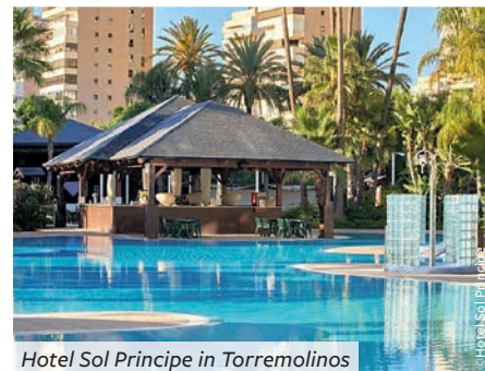
Hotel Sol Principe in Torremolinos

Das Hotel Sol Principe in Torremolinos steht ca. 150 Meter vom Meer entfernt und bietet einen direkten Zugang zum Strand von Playamar. Die Entfernung zur Altstadt von Torremolinos, die sich ca. 50 Meter oberhalb der Strandpromenade erstreckt, mit vielen Geschäften und Restaurants beträgt ca. 1,5 km. Die hellen, komfortablen Zimmer sind ca. 20 qm groß, verfügen über einen Balkon