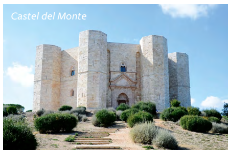
Castel del Monte

übereinander liegenden Grotten, zahlreiche Felsenkirchen mit raffinierten Innendekorationen und malerische Aussichtspunkte bilden eine einzigartige Kulisse. Seit 1993 gehört die Altstadt von Matera zum UNESCO-Weltkulturerbe: „Eine der unglaublichsten organisierten Stadtstrukturen der Erde, ein absolutes Meisterwerk des Geistes und der Anpassungsfähigkeit“, sagt die UNESCO.