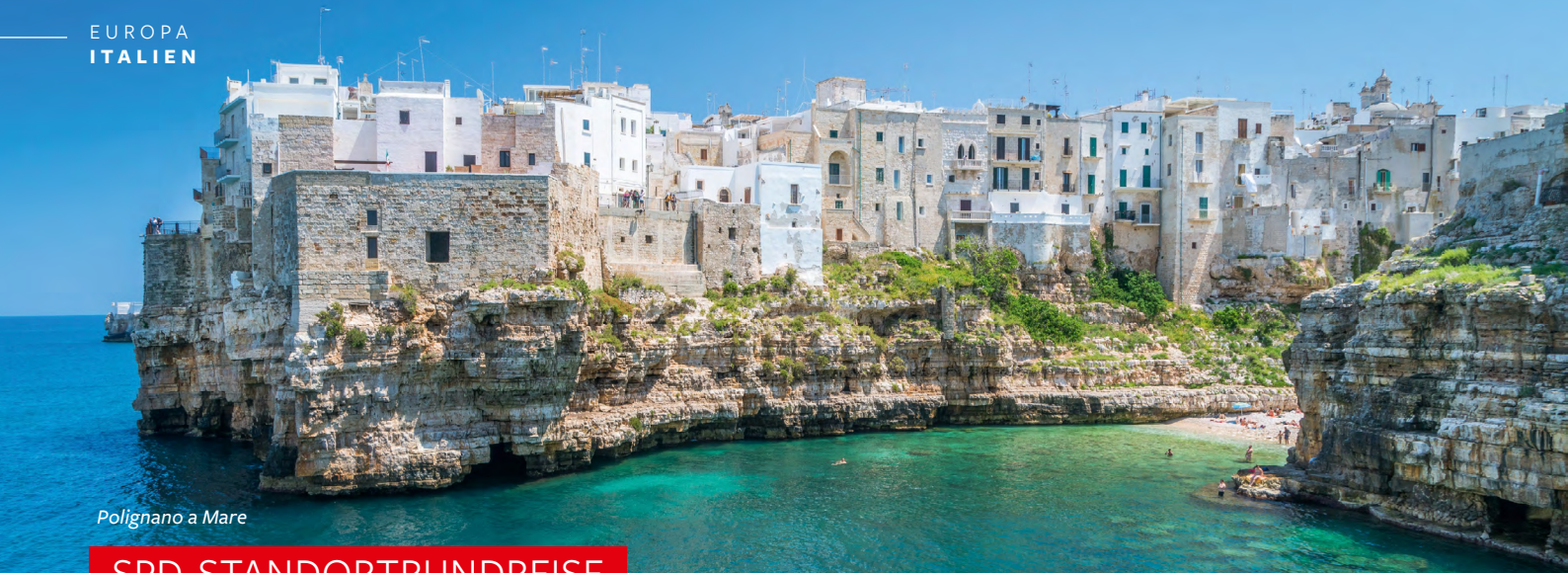
Polignano a Mare