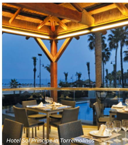
Hotel Sol Principe in Torremolinos

Poollandschaft und sind mit Wanne oder Dusche/WC, Föhn, Telefon, Sat-TV, WLAN sowie Heizung ausgestattet (Safe gegen Gebühr). Einzelzimmer sind Doppelzimmer zur Alleinbenutzung. In den beiden Restaurants werden die Speisen in Büfettform und mit Show-Cooking angeboten. Den Hotelgästen steht außerdem ein Hallenbad zur Verfügung.