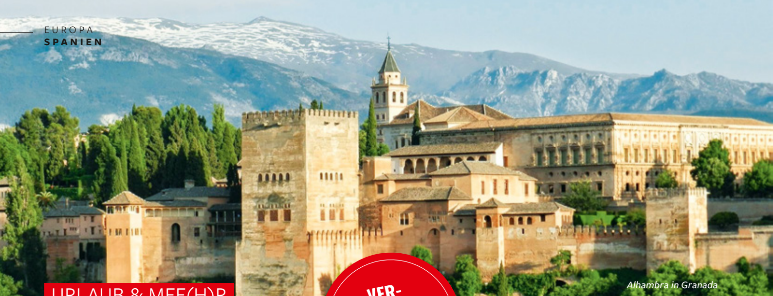
Alhambra in Granada