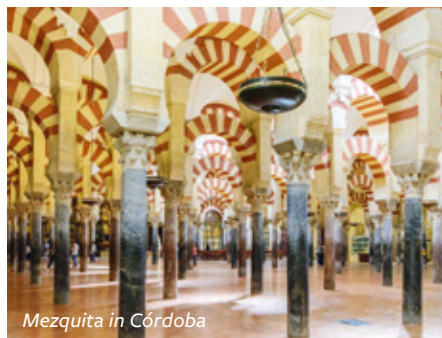
Mezquita in Córdoba

In seiner Glanzzeit gehörte Córdoba zu den größten Städten der bekannten Welt. Sichtbarer Ausdruck der maurischen Pracht ist die unvergleichliche „Mezquita“ – einst Moschee und heute Kathedrale –, ein Höhepunkt der Weltarchitektur. Daneben ist die Judería – die Altstadt, in der früher Juden und Araber lebten – mit ihren engen Gassen eine weitere der großen Sehenswürdigkeiten Córdobas.