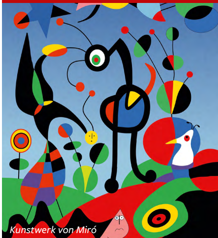
Kunstwerk von Miró