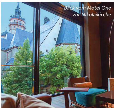
Blick vom Motel One zur Nikolaikirche

Heute endet die Reise und alle Gäste kehren in ihre Heimatorte zurück – eigentlich ... Wer möchte, kann nämlich seinen Leipzig-Aufenthalt mit einem ganz besonderen Konzerterlebnis ergänzen. Vormittags lernen wir bei einer Hausführung viele Details der Architektur und der Innenausstattung des Gewandhauses kennen und wandeln an-