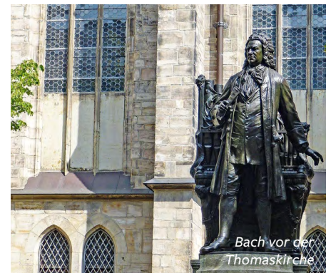
Bach vor der Thomaskirche

„Vom Eise befreit sind Strom und Bäche/Durch des Frühlings holden, belebenden Blick/Im Tale grünet Hoffnungsglück“, dichtete Goethe einst in seinem „Osterspaziergang“. Während seines fast dreijährigen Aufenthaltes in Leipzig studierte er nicht nur Rechtswissenschaften, sondern durchaus auch das Leben, wurde häufig in „Auerbachs Keller“ gesichtet und genoss die Annehmlichkeiten der kunstsinnigen Stadt.