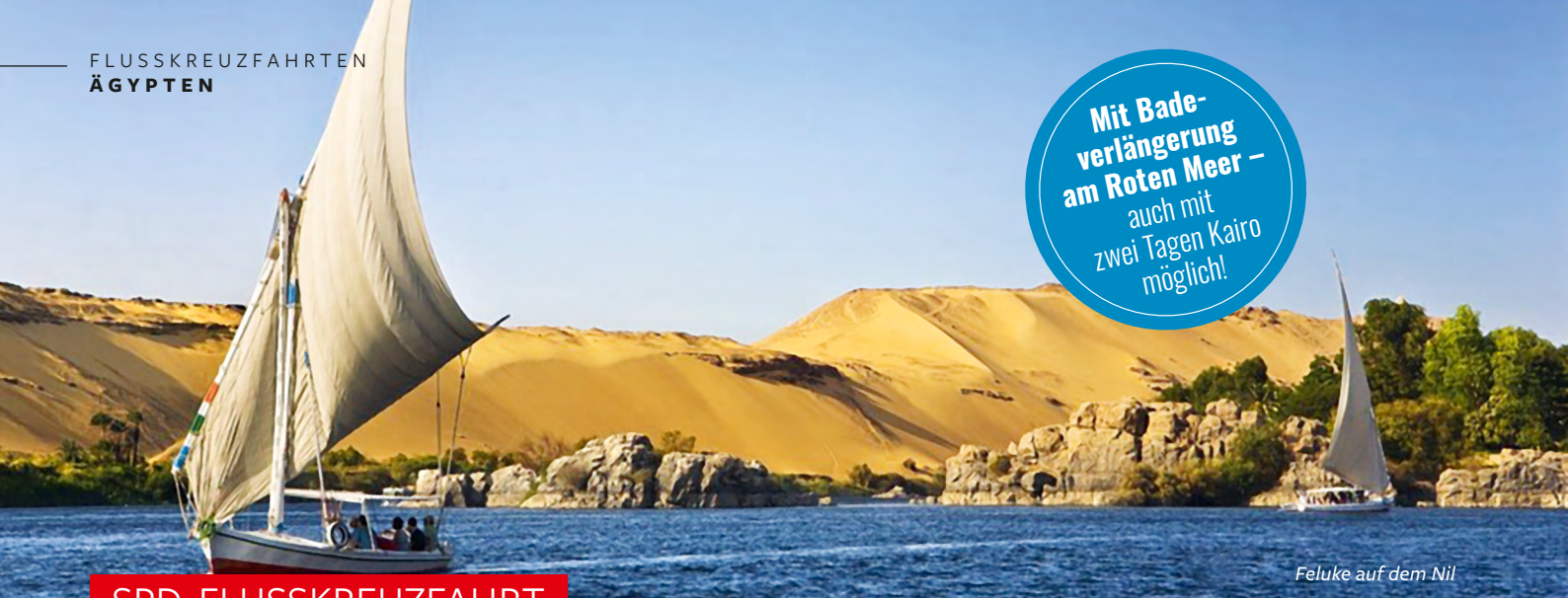
Feluke auf dem Nil

Mit Bade- verlängerung am Roten Meer – auch mit zwei Tagen Kairo möglich!