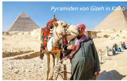
Pyramiden von Gizeh in Kairo