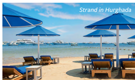
Strand in Hurghada

Erstklassiges Strandhotel für Erwachsene, mit großem Spa-Bereich in bester Lage, direkt am hoteleigenen flach abfallenden Sand-