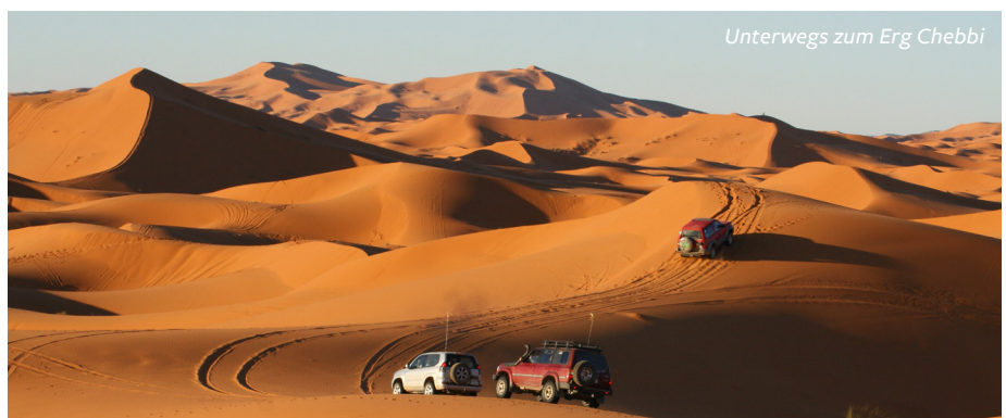
Unterwegs zum Erg Chebbi