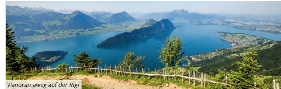
Panoramaweg auf der Rigi

Wir lernen Chur, die älteste Stadt der Schweiz, kennen. Am Nachmittag besteigen wir den Glacier Express, den "langsamsten Schnellzug der Welt". Die Strecke ist abschnittsweise als Zahnradbahn angelegt, sodass der Zug mühelos große Höhenunterschiede überwinden kann. Durch die grandiose Schlucht des oberen Rheins erreichen wir am Oberalppass mit 2044 m den Scheitelpunkt der Strecke. In engen Windungen schlängelt sich der Zug durch die Hochgebirgslandschaft und schließlich ins Rhônetal hinunter, steigt dann wieder an, bis wir nach ca. fünfstündiger Reise in Zermatt eintreffen. Der zu Füßen des Matterhorns gelegene Bergort ist autofrei und umso schöner von uns zu Fuß zu erkunden. Unser Gepäck reist mit uns ab Chur und wird in Zermatt zum Hotel transportiert.