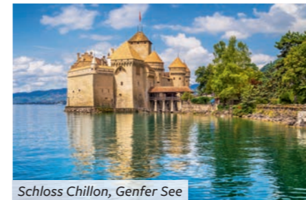
Schloss Chillon, Genfer See