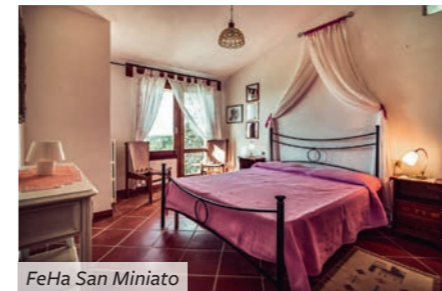
FeHa San Miniato