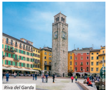
Riva del Garda