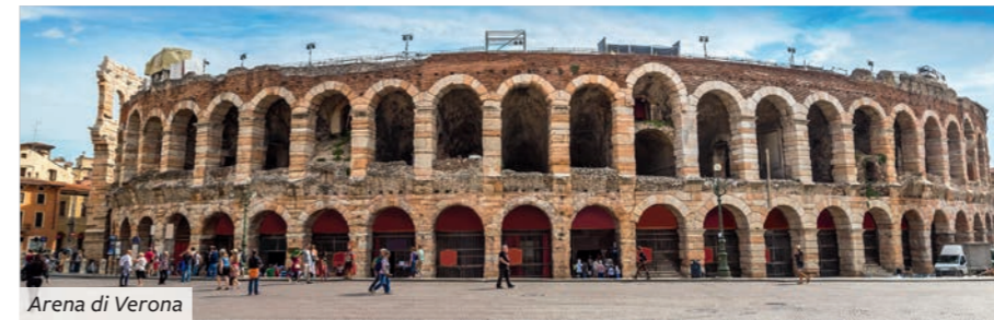
Arena di Verona