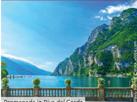
Promenade in Riva del Garda