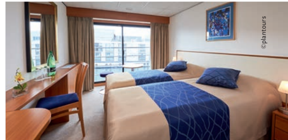
MS ROUSSE PRESTIGE Kabinenbeispiel (vor Renovierung)