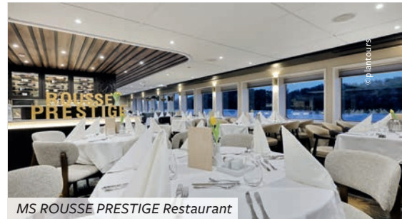
MS ROUSSE PRESTIGE Restaurant