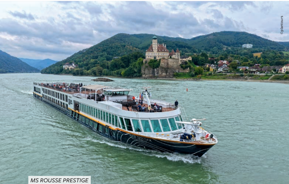
MS ROUSSE PRESTIGE