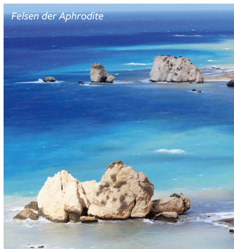
Felsen der Aphrodite

Im Dorf Geroskipou besuchen wir die Fünfkuppelkirche Agia Paraskevi aus dem 9. Jh. mit ihrer eindrucksvollen byzantinischen Architektur. Wir entdecken Paphos, das mit seiner 2000 Jahre alten Geschichte heute zum UNESCO-Weltkulturerbe gehört. Wir besichtigen die Königsgräber aus hellenistischer Zeit und sehen die prächtigen römischen Mosaiken in den Häusern des Dionysos. Gelegenheit zum Mittagessen in einer typischen Fischtaverne im alten Hafen. Weiterfahrt zum Kloster des Heiligen Neofytos. An einem besonders schönen Küstenabschnitt sehen wir den Felsen der Aphrodite, Petra tou Romiou, wo der Sage nach Aphrodite, die Göttin der Liebe und Schönheit, aus dem Meerschäum geboren wurde.