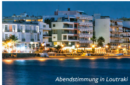
Abendstimmung in Loutraki

und den römischen Markt, bevor wir die reizvollen Landschaften von Nemea kennenlernen, dem größten Weinanbaugebiet auf dem Peloponnes. Natürlich gehört dazu auch der Besuch einer Weinkellerei.