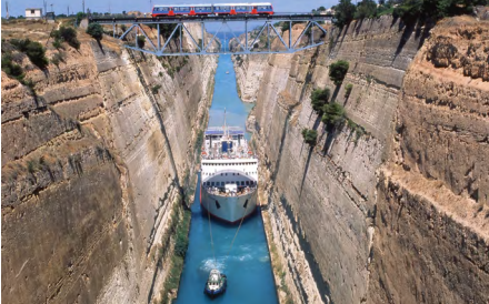
Kanal von Korinth

Erkundungsfahrten aus unserem inkludierten Ausflugsangebot, das die Schönheiten rund um unseren Urlaubsort präsentiert.