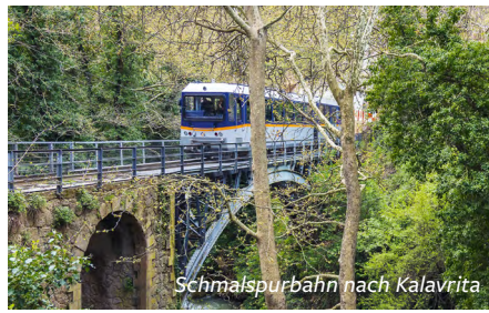
Schmalspurbahn nach Kalavrita

Wir besichtigen die Ausgrabungsstätte des Apollotempels mit den mächtigen Säulen