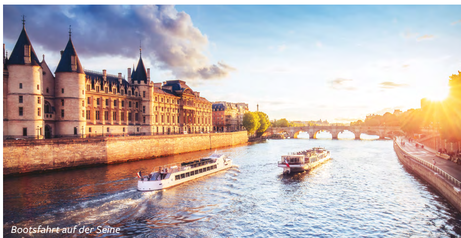
Bootsfahrt auf der Seine

de Spendenbereitschaft zum Wiederaufbau nach dem tragischen Großbrand im April 2019 erklärt. Wir wechseln dann hinüber auf das rechte Ufer der Seine, die Rive Droite, und streifen durch das 4., 3., 2. und 1. Arrondissement der historischen Innenstadt bis zum Centre Pompidou. Seine nicht unumstrittene modernistische Architektur sticht zwischen dem imposanten Rathaus, edlen Fassaden von Nobelhotels, Banken, Boutiquen, Einkaufs-Galerien, -passagen und -zentren wie dem ehemaligen Großmarkt Les Halles deutlich hervor. Ein schöner Abschluss für das gemeinsame Tagesprogramm ist die Bootsfahrt auf der Seine. Vorbei an Notre-Dame, dem Louvre, dem Eiffelturm und der Nationalversammlung erleben wir eine Stunde lang die „Stadt der Liebe“ aus neuer Perspektive und erfahren dabei noch viele interessante Details über die französische Hauptstadt und ihre Bewohner.